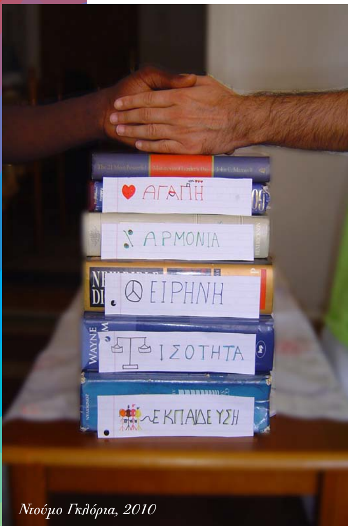
Ντούμιο Γκλόρια, 2010

Ο διαγωνισμός απευθύνεται σε μαθητές και μαθήτριες της Πρωτοβάθμιας και Δευτεροβάθμιας εκπαίδευσης από όλη την Ελλάδα. Κάθε χρόνο τα παιδιά της Ε΄ και ΣΤ΄ Δημοτικού διαγωνίζονται στην κατηγορία των εικαστικών και της έκθεσης – «Σκέφτομαι και Γράφω» αντίστοιχα, ενώ οι μαθητές της Γ΄ Γυμνασίου, της Α΄ Γενικού Λυκείου και της Α΄ Επαγγελματικού Λυκείου μπορούν να συμμετέχουν με γρα-πτό κείμενο (χρονογράφημα, δοκίμιο, αρθρογραφία) ή με καλλιτεχνική δημιουργία (φωτογραφία, οπτικοακουστικό μήνυμα). Τα τελευταία χρόνια μάλιστα λαμβάνουν μέρος στο Διαγωνισμό και ασυνόδευτα παιδιά πρόσφυγες που μοιράζονται μαζί μας την προσωπική τους ιστορία και δίνουν ένα παράδειγμα δύναμης και αισιοδοξίας.