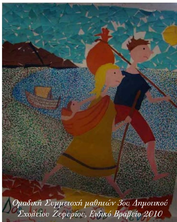
Ομαδική Συμμετοχή μαθητών 3ου Δημοτικού Σχολείου Ζεφυρίου, Ειδικό Βραβείο 2010

Αρχοντούλα Μανωλακέλη, 6ο Δημοτικό Σχολείο Μυτιλήνης, 2005